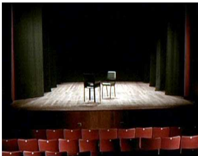
Ilustração 3 - Jogo de cena

Em Jogo de Cena , Eduardo Coutinho elabora uma dinâmica que tende a mesclar o ponto de partida das gramáticas audiovisuais, cinematográficas ou televisivas, que definem as fronteiras entre o documentário e a ficção. Não por acaso, suas entrevistas com pessoas ordinárias, característica típica do documentário, é alternada com performances de atrizes profissionais. 7 Jogo de cena , portanto, é um documentário sobre e com atrizes, que investiga o devir-personagem dessas mulheres.