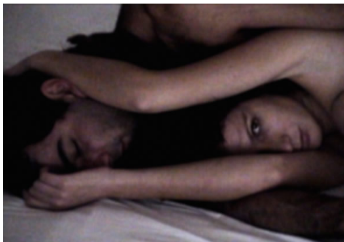
Ilustração 1 - O amor segundo B. Schianberg.

Este artigo, portanto, pretende compartilhar conceitos e análises que visam oferecer uma compreensão sobre parte da peculiaridade ética e estética de alguns documentários subjetivos. Mais do que resultados de dispositivos, os documentários que analisaremos fazem do jogo – das suas regras – as suas conseqüências – o seu motivo e objeto. Seus jogos são frágeis, fugazes e desconfiam da verve assertiva singular – a linguagem do documentário (RAMOS, 2008). Seja na representação de si, seja na representação do outro ou mesmo na análise de traumas psicológicos, são propriamente documentadas faces do processo de construção subjetiva. Processos frágeis, incipientes e incompletos. Esses documentários se lançam na aventura de (des)construir discursos de subjetividades, que, portanto, revelam-se solventes. São jogos com o sujeito; jogos subjetivos; ou apenas filmes que propõem novas dinâmicas na relação entre a subjetividade e a experiência audiovisual.