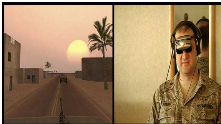
Ilustração 4 - Serious Games.

Subitamente, ocorre um atentado. O carro, visto na perspectiva subjetiva virtual, simplesmente explode. Logo após o acidente, morre um dos soldados que está ao lado do nosso jogador-soldado. Eis o trauma: a morte do outro soldado, a impotência simbólica e prática do protagonista desse curta-metragem perante a morte do colega que estava ao seu lado. Um pouco antes víamos os 'perigosos' inimigos: iraquianos maltrapilhos, com armas precárias, mas que são representados com precisão pelos códigos binários do game. Curiosamente, a hora do trauma torna-se lúdica, onírica e mesmo surreal. Nesse aspecto, o trauma desse soldado muito se aproxima do trauma do protagonista de Valsa com Bashir (Ariel Folman, 2009) – é preciso torná-lo virtual, transforma-lo numa animação para revertê-lo em realidade catártica e psicanalítica (GONÇALO, 2010).