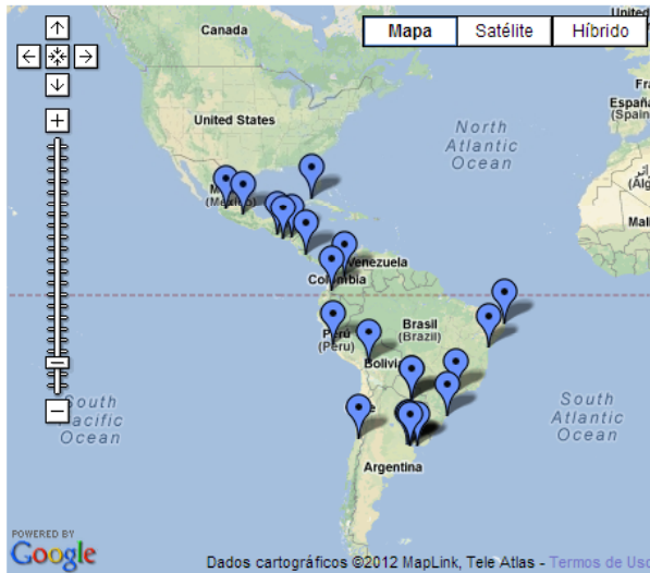
Rede Riaipe3 - América